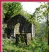
Capela Paroquial de São João

A Capela Paroquial de São João situa-se na freguesia de Aboim, no concelho de Fafe. A Capela Paroquial de São João é também conhecida por Igreja Velha, pois, em tempos, foi igreja paroquial.