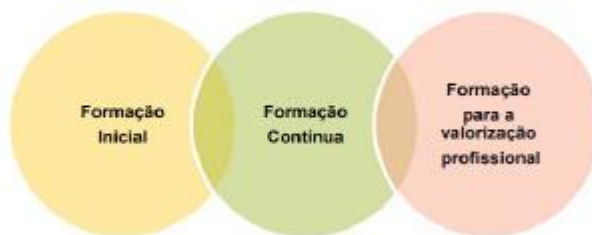
Figura 1 - modalidades de formação profissional